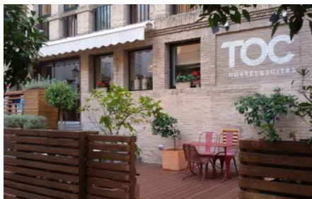
Alfa Travels favorit i Sevilla